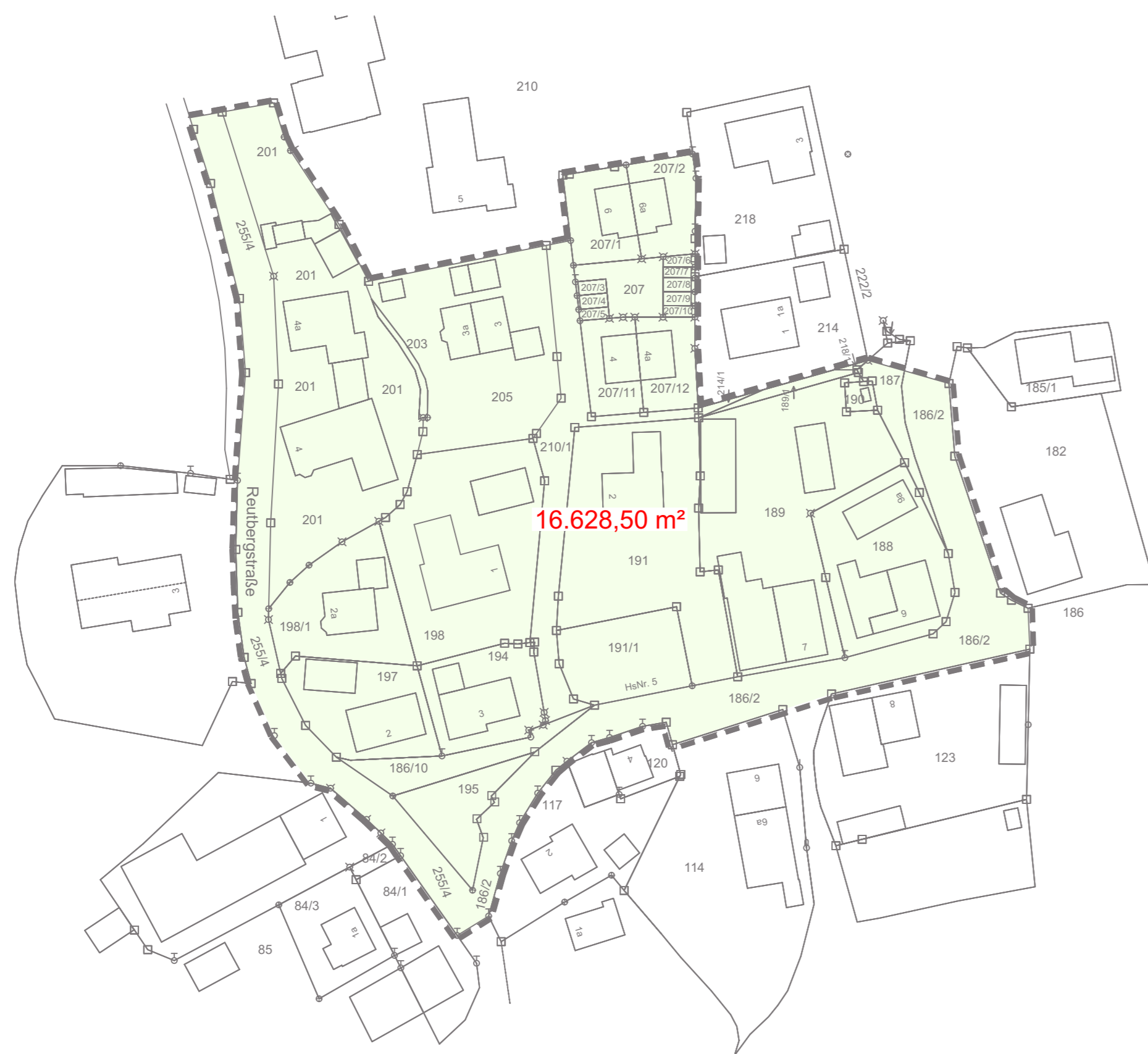
Geltungsbereich M 1:1000