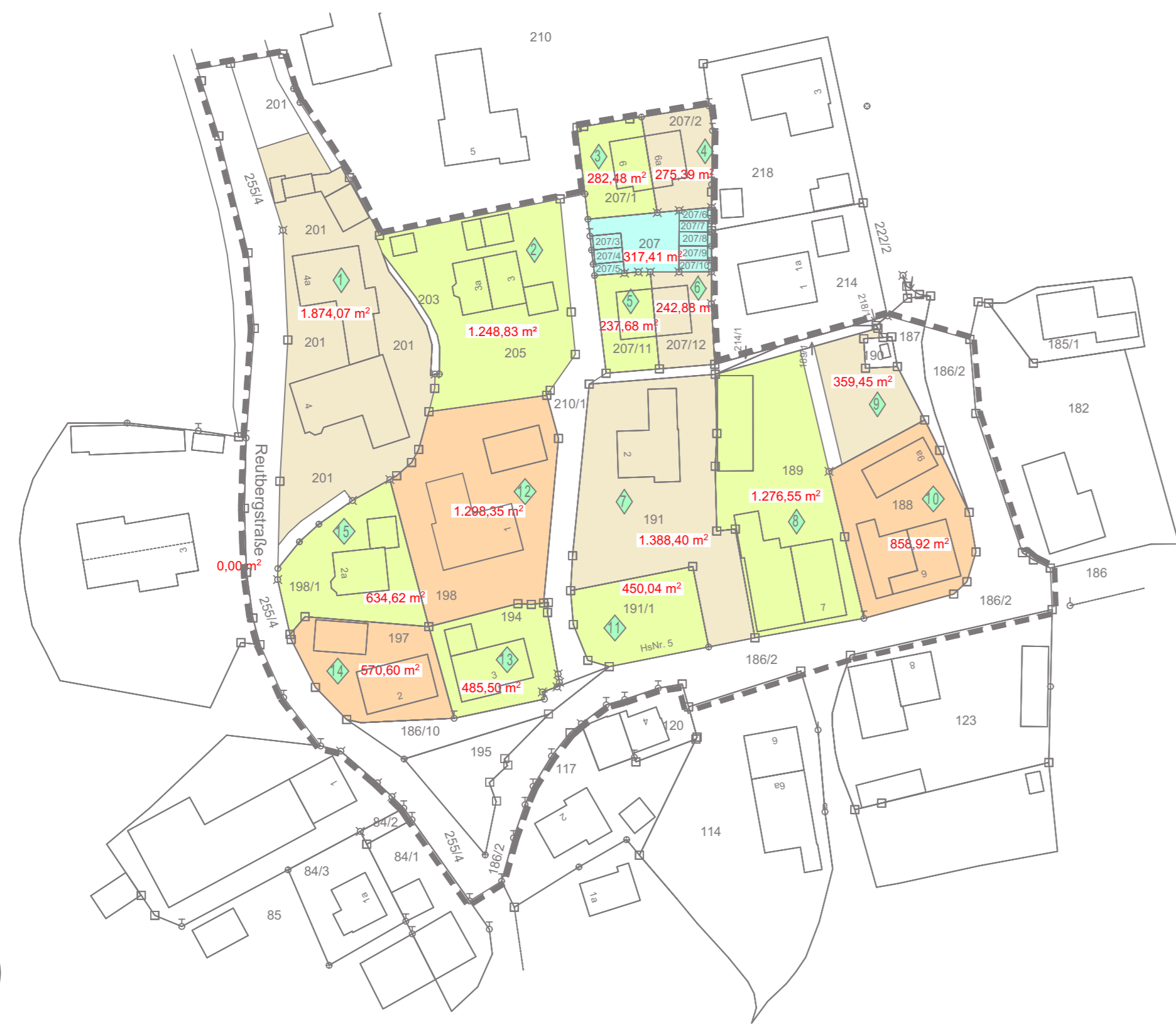
Netto-Grundstücksflächen M 1:1000