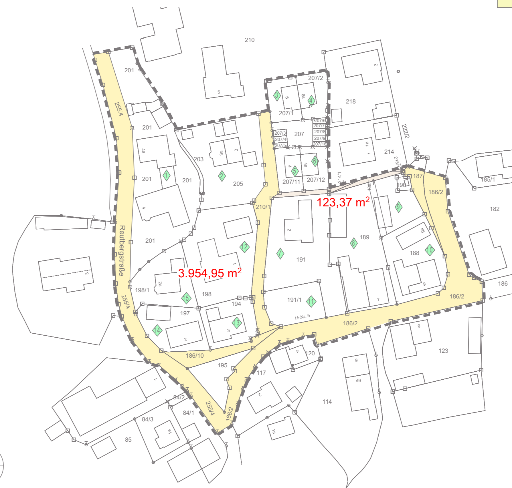
Verkehrsflächen M 1:1000

Gemeinde Sachsenkam Schulweg 7 83679 Sachsenkam