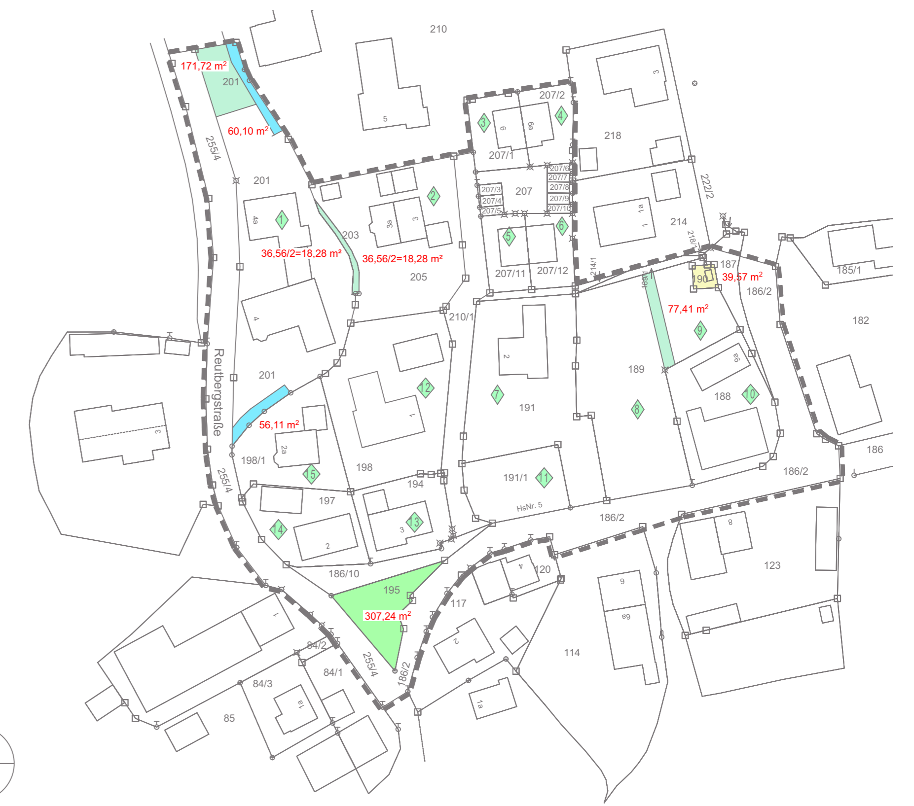
Grünflächen u. Energieversorgung M 1:1000